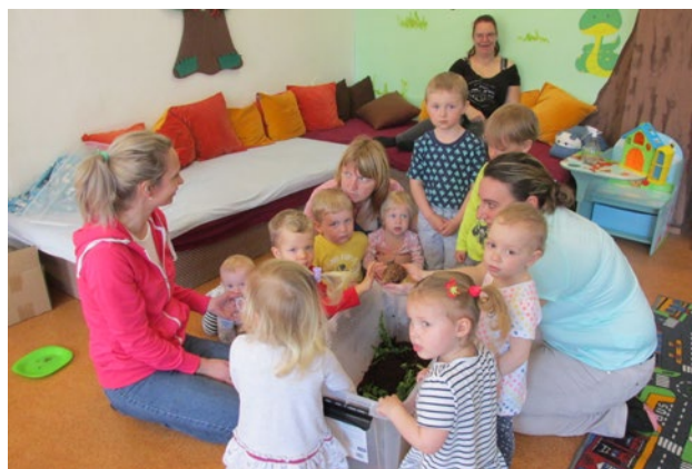
Komunita v Majáku se schází každý všední den