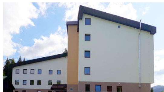
Dům s pečovatelskými byty v Harrachově

CSS poskytuje poradenství v různých ob- lastech, organizuje setkání a školení pro starosty i zastupitele přímo v místě a vy- dává Zpravodaj Mikroregionu Tanvaldska. Rovněž koordinuje přípravu a realizaci projektových záměrů v různých oblas- tech od cestovního ruchu přes dopravní obslužnost, odpadové hospodářství až po sociální služby. Cílem tohoto snažení je všestranný rozvoj obcí i území mikroregio- nu jako celku.