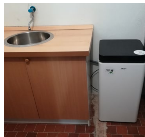
Kuchyňský elektrokompostér JRK

Máte dobrý nápad pro vaši neziskovku či podnik a nevíte si rady, jak získat podporu? Navštivte Centrum společných služeb Tanvaldsko, rádi vám pomůžeme!