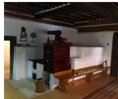
Světnice Antala Staška v jeho rodném domě