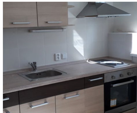
Vybavení pečovatelského bytu v Harrachově