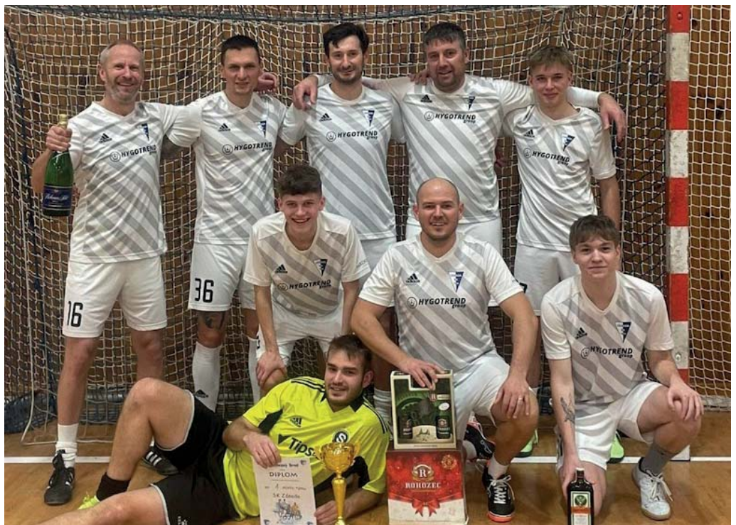
Rozpis utkání na jaře v areálu SK Zásada